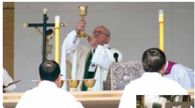
El Papa Francisco celebró las misas masivas con vino de misa producido en nuestra diócesis de Rancagua.

Éste proviene de la viña de la Parroquia Isla de Yaquil que lanzó la edición especial “Francisco”.