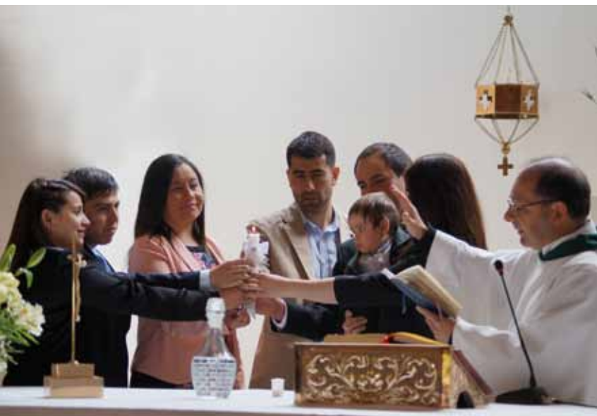
El padre Jorge hace bastante hincapié en el cambio de metodología formativa para la catequesis, que motive e incentive a los feligreses, de forma más entretenida especialmente para los más jóvenes.