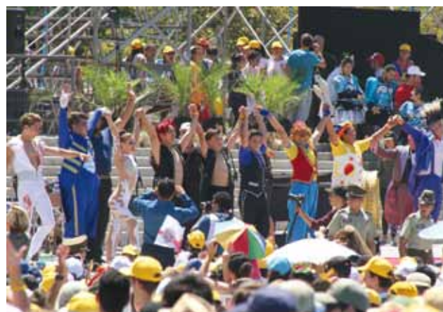
La alegría de los jóvenes en el encuentro con el Papa Francisco en el Santuario de Maipú.

El Papa Francisco estuvo pocos días en Chile, pero su agenda fue intensa con un alto significado, llenos de gestos que quedarán en la historia de su visita. Aquí un breve resumen de estos momentos.