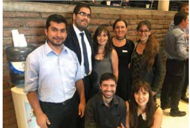
Teólogos de la Universidad Católica que participaron en el encuentro con el Papa Francisco.

“ F ue una bendición el haber podido participar junto a tres mil personas más en la visita que el hermano Obispo de Roma realizó a la Universidad Católica de Chile el pasado 17 de enero. ¿Qué rescato de su mensaje? En primer lugar la profundidad y contundencia humana, teológica y espiritual de sus palabras. Francisco invita a los académicos, estudiantes y administrativos a hacer «universitas», universo, reconocimiento de lo plural. No podemos quedarnos en nuestro pequeño mundo. Hay que abrirse a otras expresiones y experiencias. Segundo, la importancia de superar el «mundo líquido». Francisco usó esta expresión popularizada por el sociólogo Zygmund Baumann. Lo líquido expresa lo frágil, inestable y fragmentado de la vida. Hay que luchar contra eso desde una «gramática del diálogo que provoca encuentro» dice el Papa. Finalmente a los académicos nos instó a ser «maestros», no meros profesores. Un