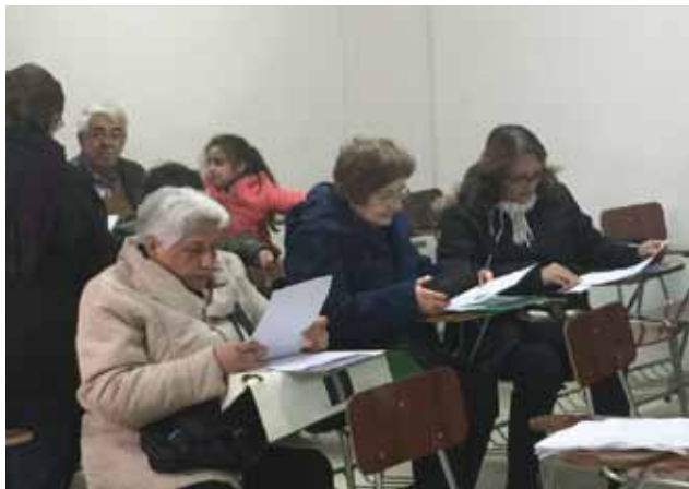
Participantes del proyecto 2017, realizado con fondos de Cuaresma de Fraternidad.

También es el tiempo de la Campaña de Cuaresma de Fraternidad, donde Caritas diocesana invita a aportar recursos para los distintos proyectos sociales, sobre todo en beneficio de los adultos mayores.