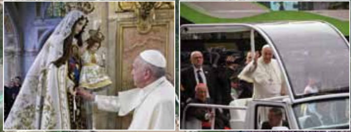
Más de 400 mil personas participaron en la primera masiva celebrada por el Papa Francisco en su visita a nuestro país.