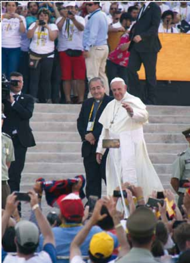
El Papa Francisco en el Santuario de Maipú en el Encuentro con los jóvenes, donde los llamó a poner de contraseña "¿Qué haría Cristo en mi lugar?".