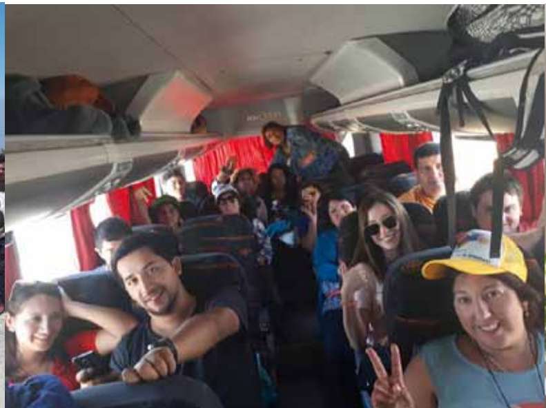
Los jóvenes fueron fundamentales en el apoyo para concretar el viaje al Parque O'Higgins.