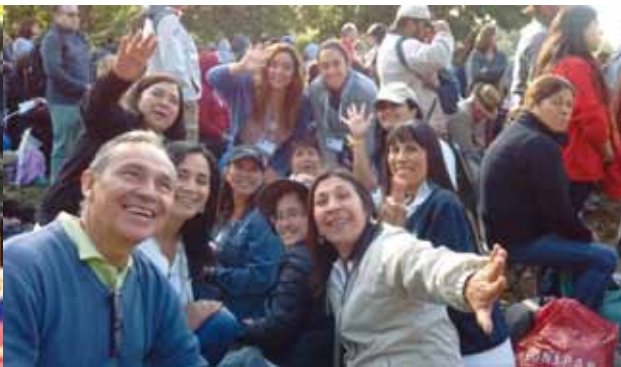
Representantes del Instituto O'Higgins.

Este grupo se reunió a la 1.30 a.m. en el Colegio Santa Inés de San Vicente para luego juntarse a las 2 a.m. en la plaza de la ciudad con los feligreses de la Parroquia.