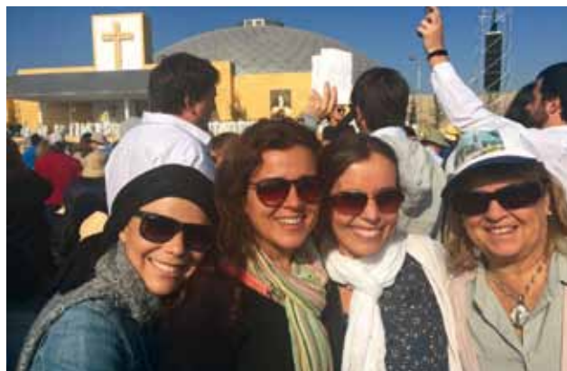
Feligreses de la Parroquia Inmaculada Concepción de Peumo.

que no vamos a poder vivir en muchos años y espero que la visita del Papa Francisco reavive nuestra fe y nos comprometa en nuestra condición de religiosas y, sobre todo, a ser coherentes con lo que practicamos y lo que decimos y a no quedarnos encerrados, sino a salir y hacer ruido". Ellos se reunieron en el colegio Santa Inés a la 1:30 a.m para juntarse a las 2 a.m. en la plaza con los feligreses de la parroquia de San Vicente. En total viajaron tres buses.