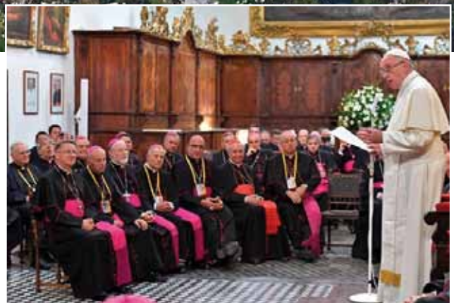
Encuentro con los obispos en la Catedral de Santiago.