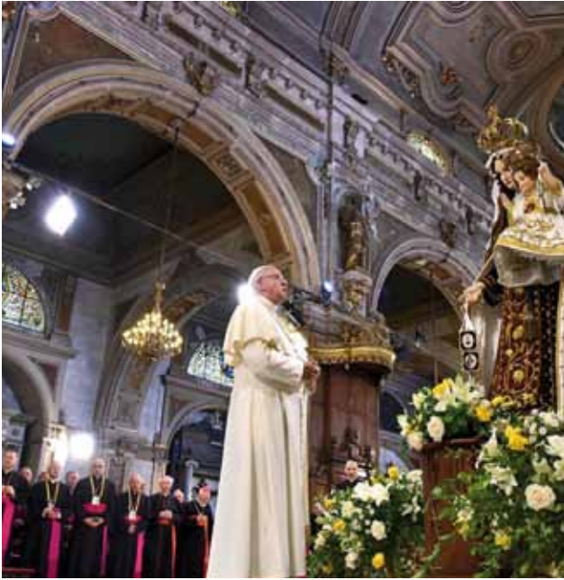
En la oportunidad, el Papa llamó a los consagrados a tomar conciencia que todos somos Iglesia.