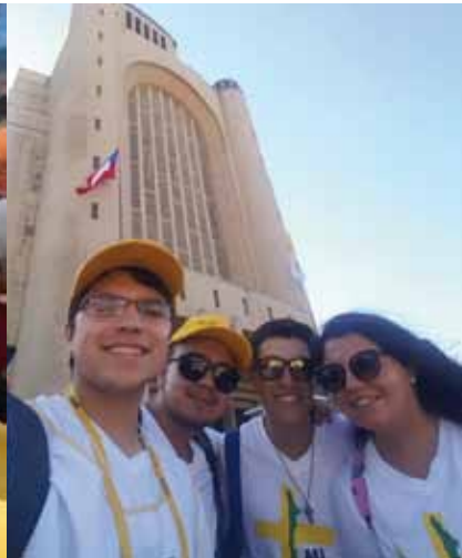
El equipo de coordinadores voluntarios de la Diócesis de Rancagua.