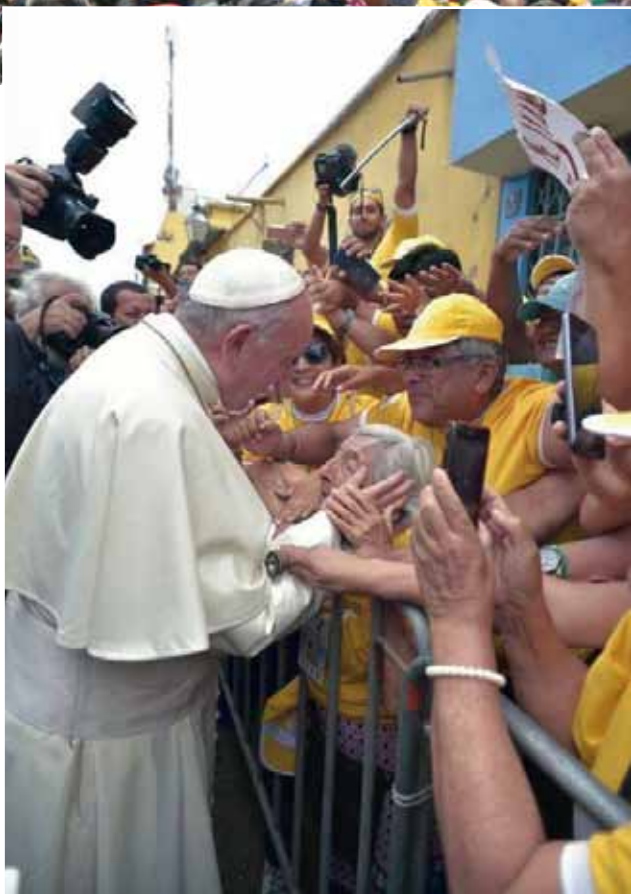
Francisco caminó en varias oportunidades para saludar a la gente que esperaba verlo pasar.

Durante la visita del Santo Padre hubo momentos que quedarán en la retina de los chilenos.