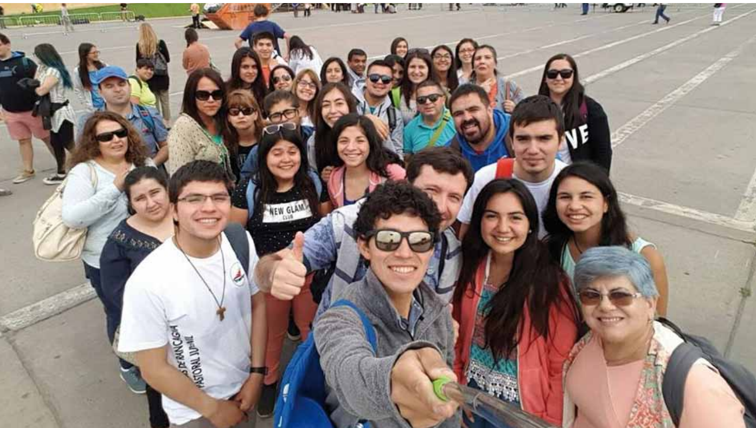
Más de 100 jóvenes de nuestra diócesis se inscribieron para ser voluntarios papales.