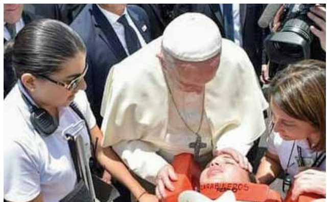
El Santo Padre bajó del papamóvil al ver caer a una carabinera del caballo.