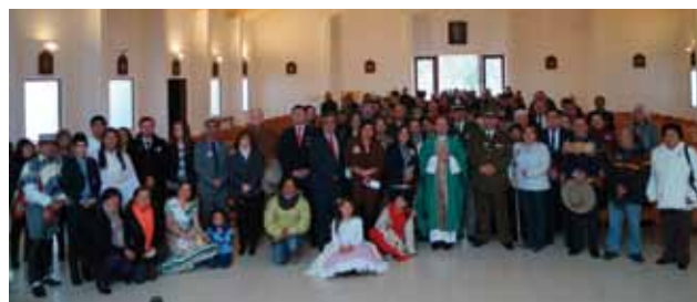
La celebración de Fiestas Patrias en Litueche.

En las siete comunidades de la Parroquia de Litueche es fundamental la devoción popular de la gente, pero siempre unida a lo pastoral y sacramental. Es así como además de tener grupos de canto a lo divino y cuasimodistas, entre otros, existe el grupo de oración