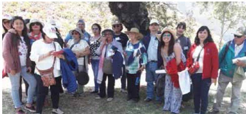
La Parroquia de Pichilemu no podía estar ausente en la primera misa masiva del Papa Francisco.