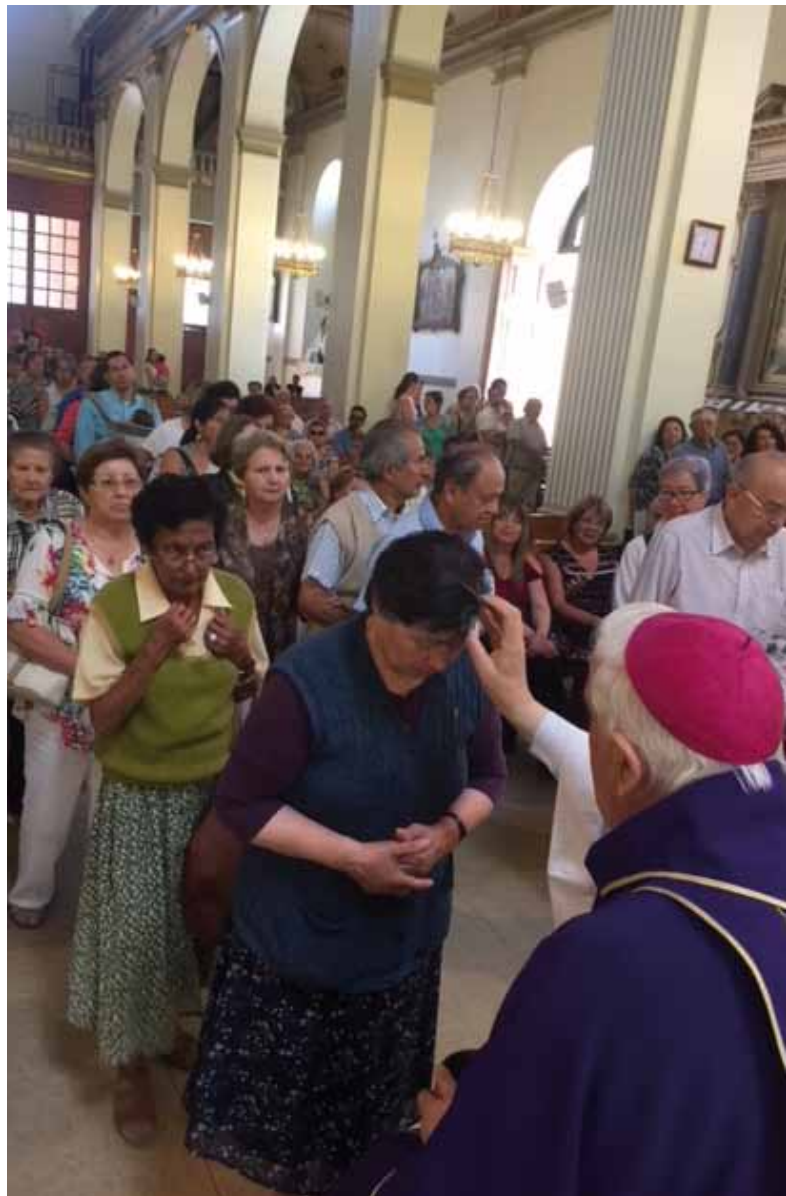
El Miércoles de Ceniza comenzó el tiempo de Cuaresma.

“Este año 2018 realizaremos dos cursos similares, en San Fernando y esperamos también hacerlo en Santa Cruz; además, esperamos reforzar y animar la pastoral del Adulto mayor diocesana, formando nuevas organizaciones, al alero de la Iglesia”, señala el padre. Para poder concretar estos proyectos, que han sido de ayuda para muchos, se requiere de los aportes que generosamente se entregan a través de la tradicional cajita-alcancía de Cuaresma de Fraternidad. Ésta se puede retirar en las parroquias y se debe devolver antes de Domingo de Ramos.