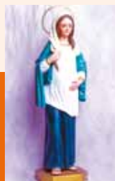
La virgen María embarazada, Nuestra Señora de la Esperanza.