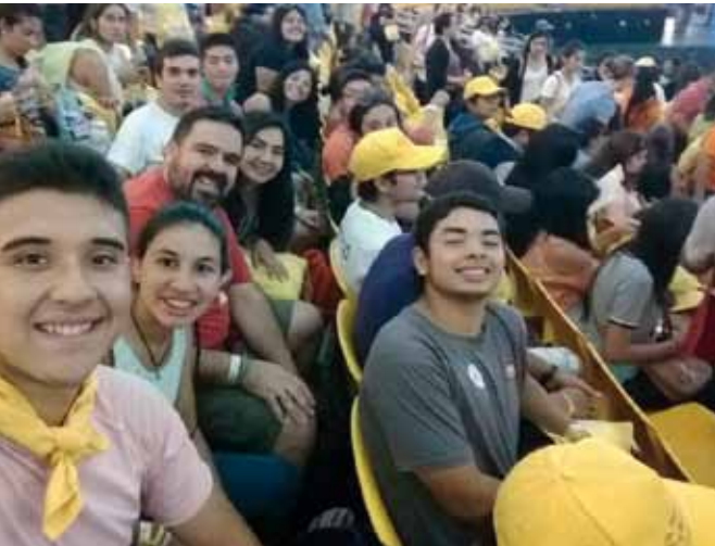
Felices los jóvenes acudieron al llamado a ser voluntarios papales para apoyar la visita del Papa Francisco en diferentes funciones.