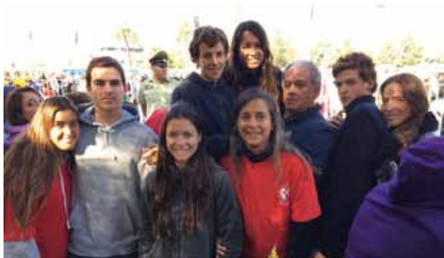
Profesores, alumnos y apoderados del Colegio La Cruz, de Rancagua.