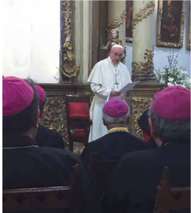
El Papa Francisco se reunió en la Catedral de Santiago con presbíteros, consagrados, diáconos permanentes y obispos de nuestro país.