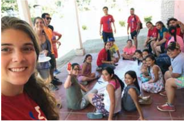
Grupo de misioneros junto a los niños.