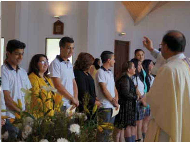
Los sacramentos son fundamentales en la parroquia Nuestra Señora del Rosario. Es así como cada vez más personas adultas se están bautizando y confirmando.

devoción popular manifestada a través de las fiestas patronales, las procesiones, el canto a lo divino y el Rosario del alba”, argumentó.