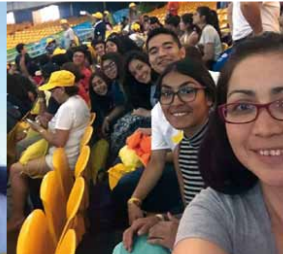
Tras participar en tres capacitaciones, el 13 de enero se reunieron en el Movistar Arena para la acreditación final y el Envío.