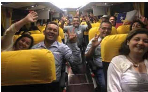
La Parroquia San José de Chimbarongo muy temprano salió rumbo al Parque O'Higgins.