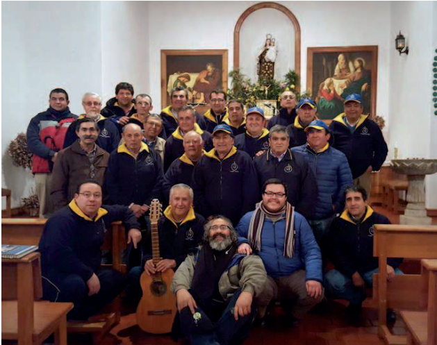
Los madrugadores se un grupo de más de 30 varones que se reúnen constantemente para reflexionar y ayudar en diferentes acciones pastorales. Ellos durante cada sábado, después de terremoto, reconstruyeron la casa parroquial.