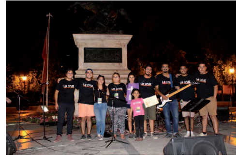
El grupo Ministerio de Música Effata, organizaron una actividad el día 12 de febrero, en la Plaza de los Héroes de Rancagua.