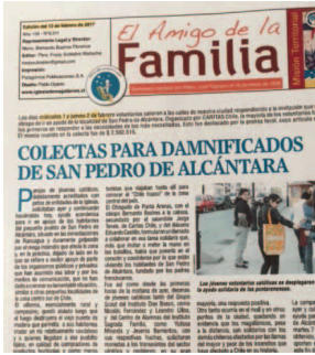
Desde Punta Arenas enviaron ayuda económica.