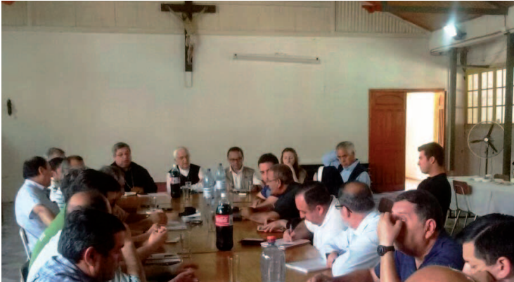
Reunión sostenida el 27 de enero para enfrentar la crisis.