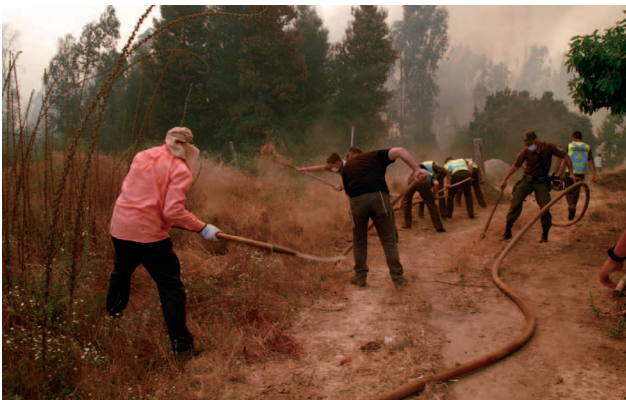
Miles de voluntarios realizaron un abnegado esfuerzo combatiendo el fuego.