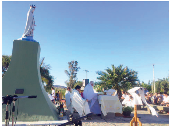
Monseñor Alejandro Goic celebró misa de acción de gracias por el cese del fuego el sábado 4 de febrero en la Parroquia Alcones – Marchigüe y el domingo 5 en Pumanque. En tanto que el 11 de febrero presidió la misa en San Pedro de Alcántara y el 12 en Santa Rosa de Pelequén.

concretas a cada una de las familias”. Así, con esperanza en medio del dolor se invitó a todas las comunidades a rezar para que el Señor protegiera a quienes trabajan en el combate de los incendios y por sus víctimas por su eterno descanso y por la fortaleza y esperanza de sus familiares y amigos.