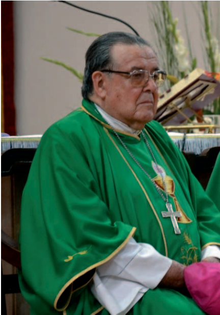
Monseñor Miguel Caviedes.