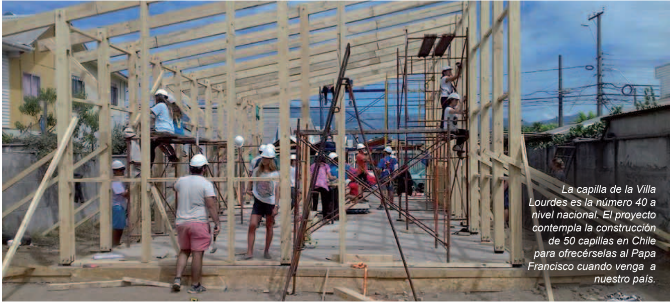
La capilla de la Villa Lourdes es la número 40 a nivel nacional. El proyecto contempla la construcción de 50 capillas en Chile para ofrecérselas al Papa Francisco cuando venga a nuestro país.