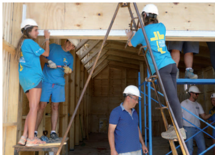
Durante diez días los jóvenes universitarios se entregan en cuerpo y alma a construir este espacio para la comunidad.