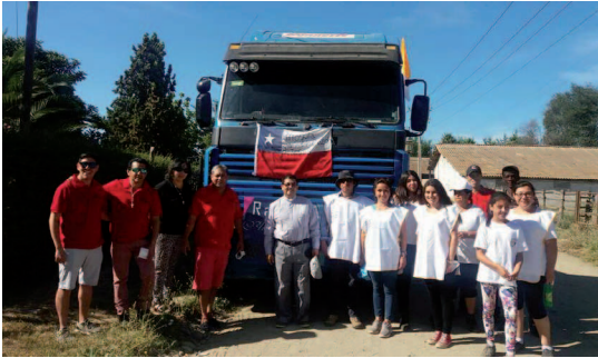
La Parroquia de Las Cabras ha sido una de las que ha colaborado con los sectores afectados.