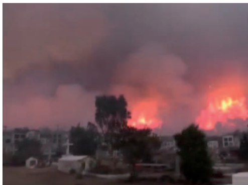
Fuego consumió cementerio de San Pedro de Alcántara