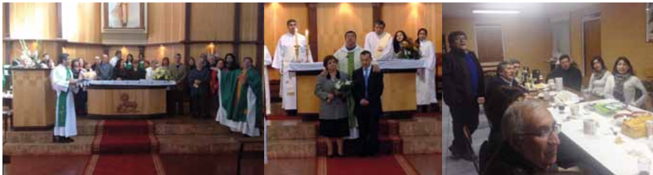
La comunicación entre los miembros de la Iglesia permite una mayor participación.

JÓVENES DE CONFIRMACIÓN APOYAN CATEQUESIS DE NIÑOS COMO UN PASO PREVIO A FORMARSE COMO CATEQUISTAS, SON ALGUNAS DE LAS INNOVACIONES IMPLEMENTADAS EN ESTA COMUNIDAD.