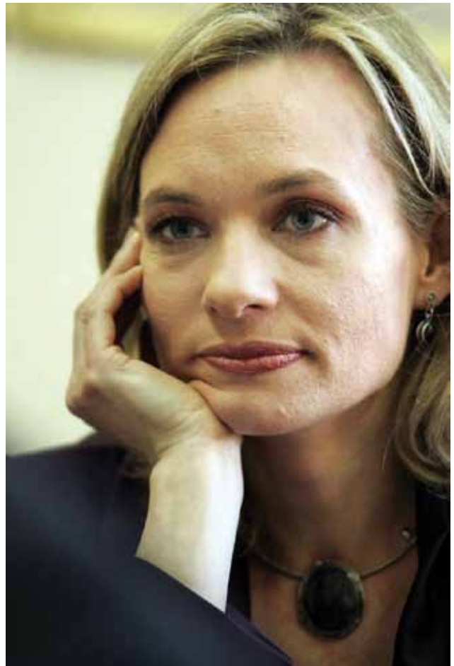
Senadora Carolina Goic

- Es importante distinguir entre eutanasia y muerte digna, en el debate público se tiende a confundir. La eutanasia