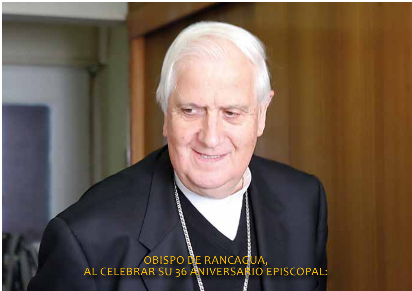
OBISPO DE RANCAGUA, AL CELEBRAR SU 36 ANIVERSARIO EPISCOPAL: