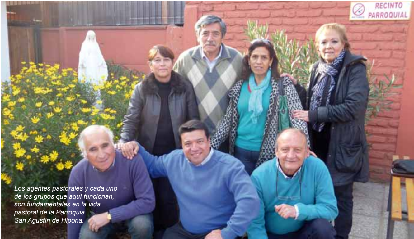
Los agentes pastorales y cada uno de los grupos que aquí funcionan, son fundamentales en la vida pastoral de la Parroquia San Agustín de Hipona.

en la parroquia funcionan diversos grupos y movimientos: “está el grupo de adultos mayores “Años Maravilloso”, las distintas catequesis pre-bautismal, 1ª comunión, confirmación, matrimonial; CALI; Ayuda Fraterna, Infancia Misionera, Custodia, que está formada por 5 personas que se turnan: dos por Eucaristía y que cumplen la función del sacristán, es decir, preocuparse de que nada falte en cada misa”.