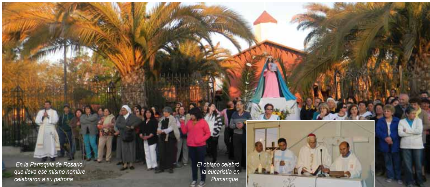
En la Parroquia de Rosario, que lleva ese mismo nombre celebraron a su patrona.