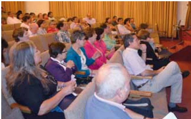
Un centenar de Laicos se reunieron en esta asamblea.