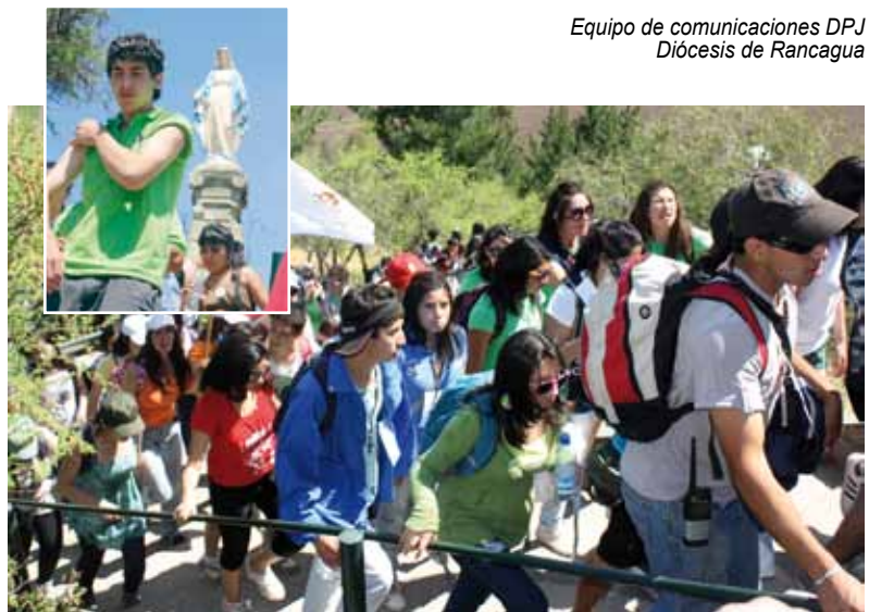
Equipo de comunicaciones DPJ Diócesis de Rancagua

¿A qué te invitamos? A vivir una verdadera fiesta de fe en donde la Iglesia quiere ser un testimonio profético de que otro mundo es posible, en el cual el Reino de Dios es un proyecto atractivo y urgente. Queremos anunciar al Señor de la historia y vivir el Evangelio de la alegría. ¿Te perderás nuestra XI Peregrinación? ¡Hoy es el tiempo de que seamos héroes y callejeros de la fe y de la vida!