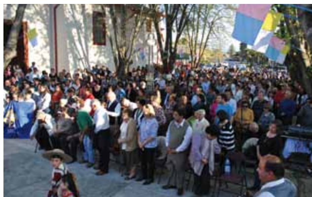
Masiva participación de la comunidad en Guacarhue.