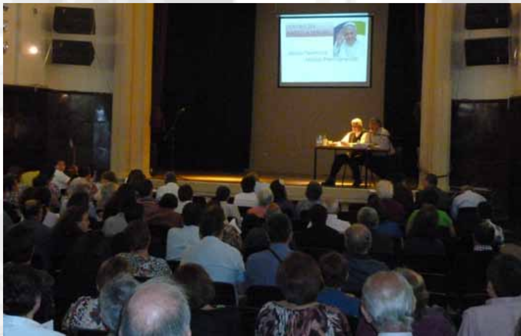
Más de 120 personas acudieron a la jornada efectuada en Peumo.

POR CADA UNO DE LOS DECANATOS HA IDO NUESTRO PASTOR DIOCESANO, JUNTO A LOS VICARIOS Y DECANOS MOTIVANDO A LAICOS Y CONSAGRADOS PARA PARTICIPAR EN ESTA NUEVA TAREA DE LA IGLESIA DE CHILE.