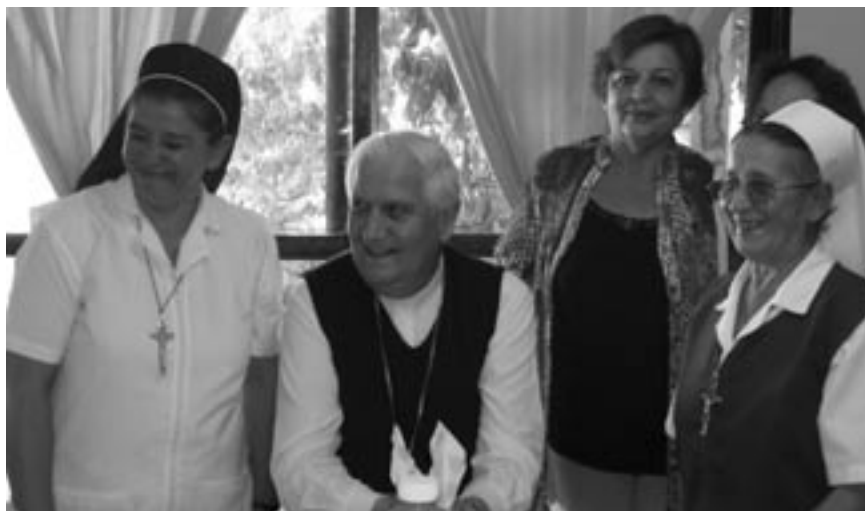
Visita al Hogar San José.

El misterio de la resurrección recorre todo este tiempo. Se lo contempla bajo todos sus aspectos durante los cincuenta días. La buena nueva de la salvación es la causa del regocijo de la Iglesia. La resurrección se presenta a la vez como acontecimiento y como realidad omnipresente, como misterio salvador que actúa constantemente en la Iglesia.