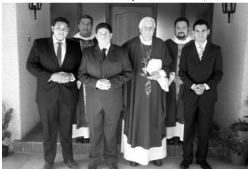
Los propedéuticos 2013 junto a nuestro pastor y los formadores.

Recordemos que esta experiencia se retomó, ya que hace algunos años no se hizo y ahora al finalizar los estudios de filosofía, el seminarista en formación irá a hacer esta experiencia pastoral por