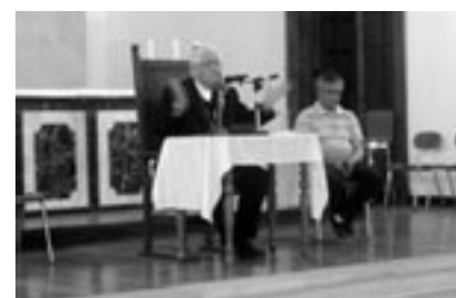
El Pastor ofreció una charla sobre el dolor, en el contexto de la Semana de Acompañamiento al Enfermo a que invita la Campaña de Cuaresma de Fraternidad.

Se promovió también a nivel parroquial el "Día de la Ayuda Fraternal", la "Semana de oración por los vivos y los muertos", y la "Adoración al Santísimo", ocasión de encuentro personal con Jesús.