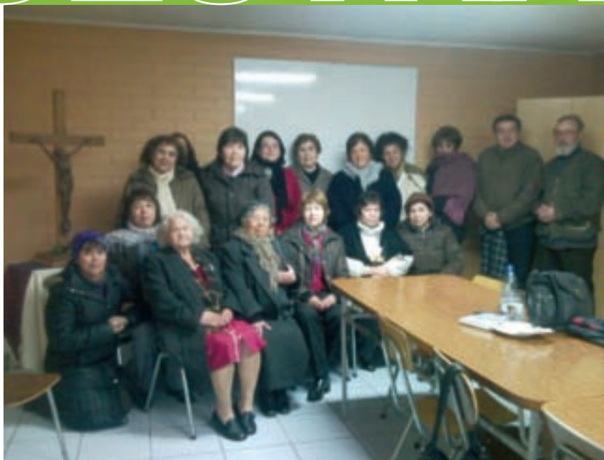
Agentes pastorales de la parroquia.

Durante el mes de agosto esta parroquia de Rancagua celebrará su fiesta patronal, poniendo énfasis en las dimensiones que propone el Sínodo diocesano de ser una Iglesia eucarística, fraterna, misionera y solidaria.