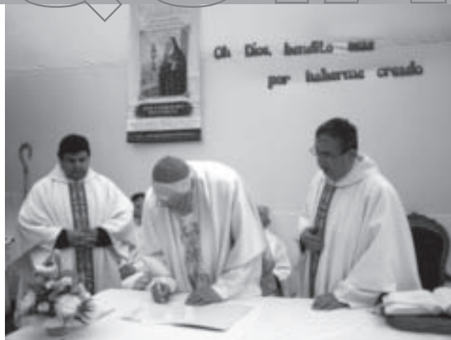
Nuestro Obispo diocesano firma los documentos que formalizan la creación de la nueva parroquia.