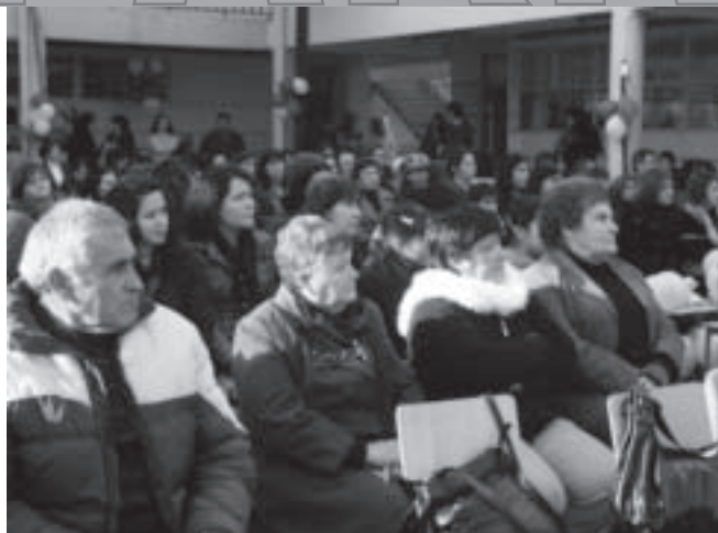
Numerosos fieles acompañaron a su nuevo párroco en esta trascendental ceremonia.