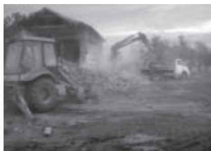
La parroquia de Tinguiririca fue demolida, para comenzar su reconstrucción.

El templo y salas pastorales de la Parroquia La Santa Cruz de Tinguiririca fueron demolidas luego de los severos daños sufridos, que la hacían a penas mantenerse en pie. De ese modo y luego de una bendición del terreno, comenzaron los trabajos de reconstrucción.